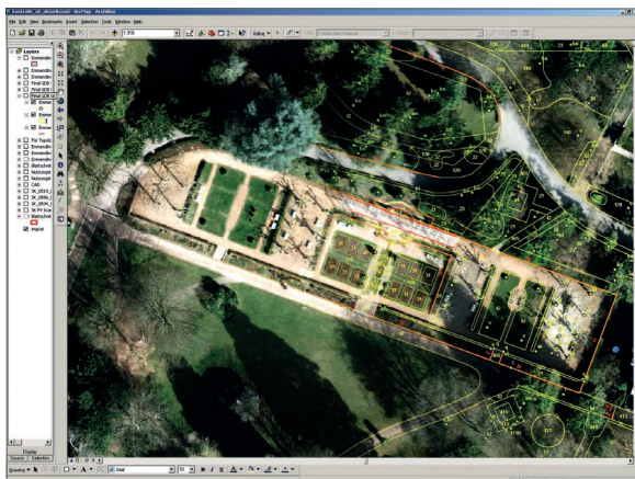
Luftbild mit und ohne Objektgrenzen

Um flächendeckende und präzise Daten zu erhalten, bieten wir Ihnen die Kartierung über Luftbilder, die terrestrische Kartierung oder eine Kombination beider Verfahren an und aktualisieren selbstverständlich auch Ihre bestehenden Daten. Im Ergebnis erhalten Sie stets ein komplettes Grünflächenkataster auf Basis moderner CAD-, GIS- und WebGIS-Anwendungen – dabei arbeiten wir herstellerunabhängig mit allen gängigen Softwarelösungen.