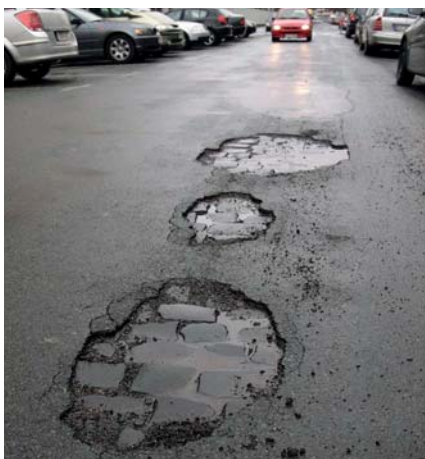
Vorausschauendes Erhaltungsmanagement schont Ihr Budget

Die so gewonnenen Informationen zum Wert Ihres Straßennetzes spielen eine wichtige Rolle bei der Aufstellung