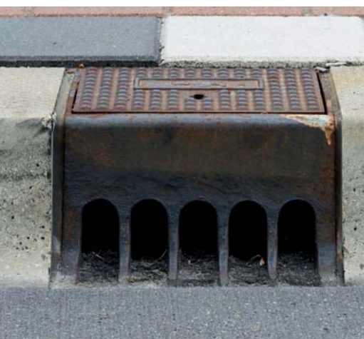
Auch kleinere Objekte entlang der Straßen werden erfasst

und ausführlich dokumentiert. Auf der Basis dieser Informationen und der zugehörigen Bauklassen ermitteln wir anschließend den Wert der erfassten Straßen und Wege nach E-EMI 2003 oder darüber hinaus und stellen Ihnen die Ergebnisse dieser Analyse in einer Straßendatenbank zur Verfügung.