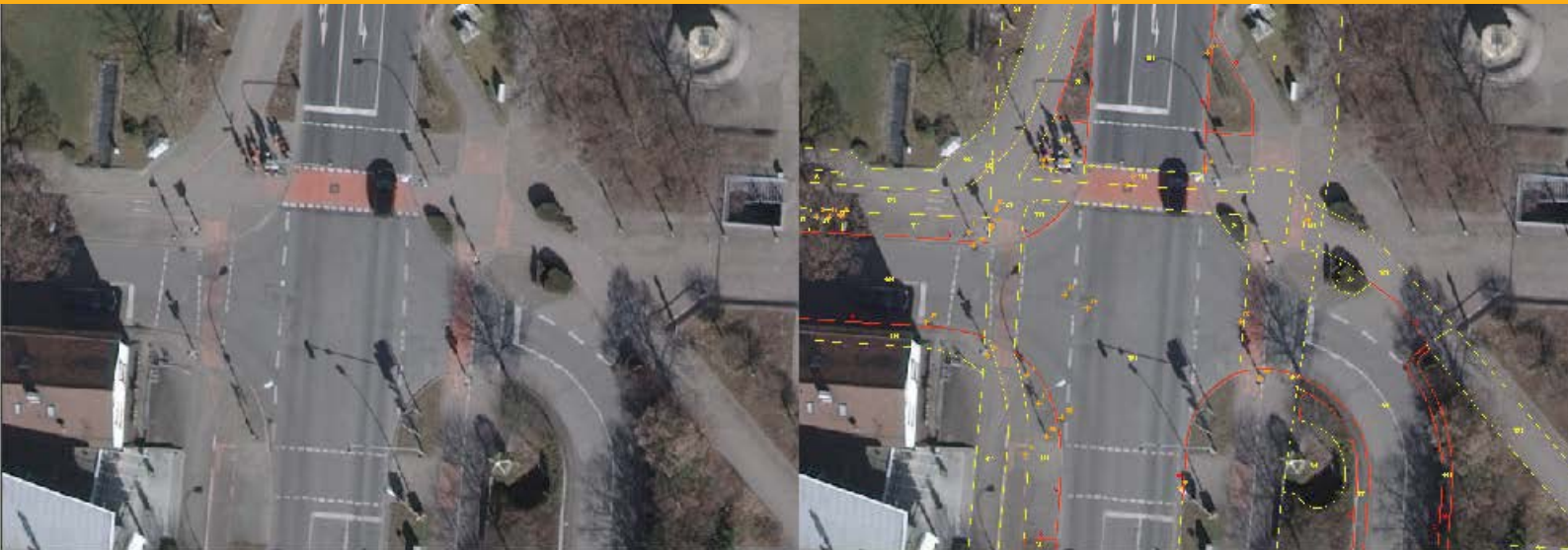
Ausschnitte eines digitalen Orthophotos, im Bild rechts mit den Ergebnissen der Luftbildauswertung

Die so gewonnenen Informationen zum Wert Ihres Straßennetzes spielen eine wichtige Rolle bei der Aufstellung